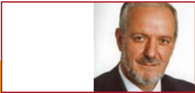
Bürgermeister Ernst Schilling, Stadt Herbolzheim